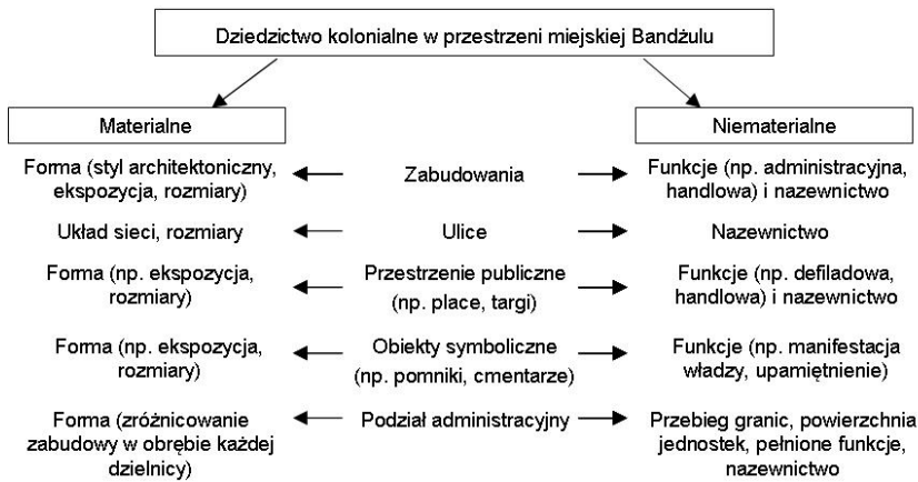
Ryc. 1. Schemat pozostałości po kolonializmie istniejących we współczesnej przestrzeni miejskiej Bandżulu