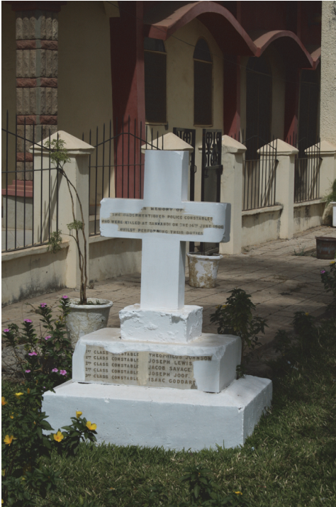
Fot. 5. Pomnik zlokalizowany w ogrodzie anglikańskiej katedry St. Mary's przy ulicy Independence Drive

Co istotne, bazar nosi imię księcia Alberta, męża królowej Wiktorii i w przeciwieństwie do miejskiego szpitala, jego nazwa nie uległa jeszcze zmianie. Obiekt ten jest więc przykładem zarówno dziedzictwa materialnego, jak i niematerialnego w przestrzeni miejskiej Bandzulu.