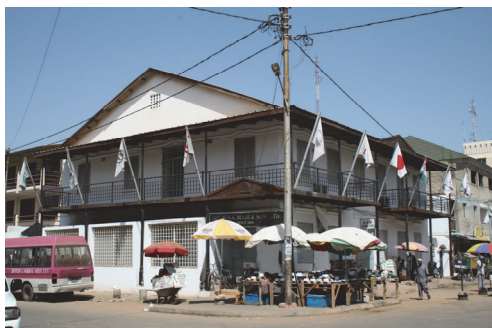
Fot. 3. Jeden z budynków usługowych w centrum gambijskiej stolicy wybudowany w 1890 roku

Photo 3. Service building in the center of the Gambian capital city, built in 1890