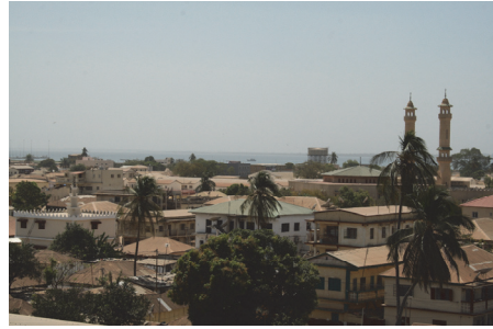
Fot. 8. Widok na Bandżul z drugiego piętra łuku Arch 22. W oddali widać minarety meczetu Króla Fahda dominujące w krajobrazie miejskim, w którym przeważają budynki z czasów kolonialnych

Photo 7. The roundabout with the monument of President Jammeh built in the end of 1990s to celebrate July 22 Revolution (which was basically a bloodless coup d'état)