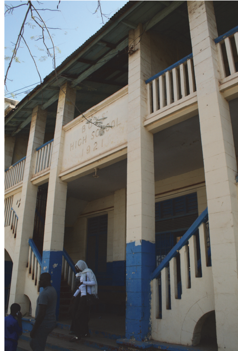
Fot. 6. Fasada szkoły metodystów przy Macoumba Jallows Street. Budynek został wzniesiony w 1921 roku i stanowi typowy przykład architektury kolonialnej z charakterystycznymi schodami po obu stronach wejścia

Photo 5. Monument in the garden of St. Mary Anglican Church on Independence Drive