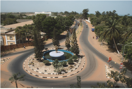
Fot. 7. Rondo z pomnikiem prezydenta Jammeha zbudowane pod koniec lat 90. XX wieku z okazji Rewolucji 22 lipca ( de facto był to bezkrwawy zamach stanu)

Photo 7. The roundabout with the monument of President Jammeh built in the end of 1990s to celebrate July 22 Revolution (which was basically a bloodless coup d'état)