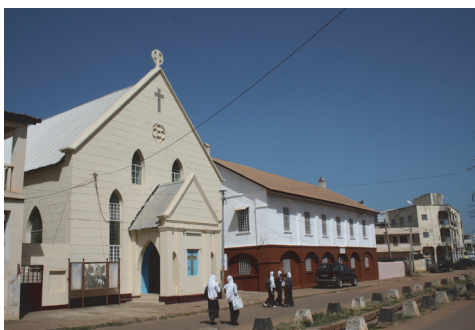
Fot. 1. Kościół metodystów w Bandżulu zlokalizowany przy Macoumba Jallows Street (dawniej Dobson Street). Obok niego budynek szkoły z czasów kolonialnych

trwały i w dalszym ciągu odbywają się w nich nabożeństwa, można stwierdzić, że są przejawem, zarazem materialnego, jak i niematerialnego dziedzictwa kolonialnego. Najstarsza świątynia to kościół Metodystów przy Dobson Street (fot. 1) oddany do użytku w 1834 roku (Saho, Roberts 2001). Kościół katolicki budowano w latach 1913-1930 (fot. 2), natomiast anglikański zwany Kościołem Angielskim lub Królewskim (obecnie jest to katedra pw. Św. Marii) ukończono w 1933 roku. Kościoły te chętnie odwiedzają turyści zwiedzający współczesny Bandżul 8 . W tym miejscu warto wspomnieć, że za zgodą władz brytyjskich, w początkach XIX wieku powstał w mieście pierwszy meczet (Saho, Roberts 2001). Na kolejny Gambijczycy, spośród których ponad 96% to muzułmanie (Jaiteh, Saho 2006), czekali aż do dekolonizacji kraju.