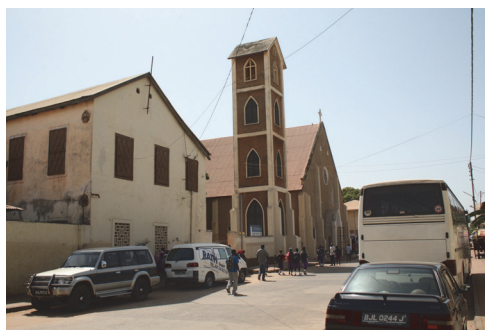
Fot. 2. Kościół katolicki pw. Św. Marii przy Daniel Goddard Street (dawniej Hagan Street)

Photo 1. Methodist Church in Banjul on Macoumba Jallows Street (formerly Dobson Street). Next to it – school building from colonial period