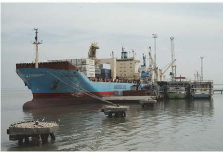
Fot. 9. Rozładunek kontenerów ze statku w stołecznym porcie morskim (największym w Gambii). Obecnie terminal jest w trakcie rozbudowy