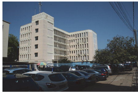
Fot.10. Przykład nowego biurowca wzniesionego w Bandżulu po 1965 roku