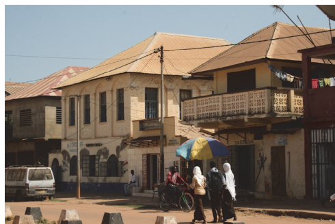
Fot. 4. Budynki z czasów kolonialnych przy ulicy Wilfried Davidson Carrol Street (dawniej Picton Street)

Photo 3. Service building in the center of the Gambian capital city, built in 1890