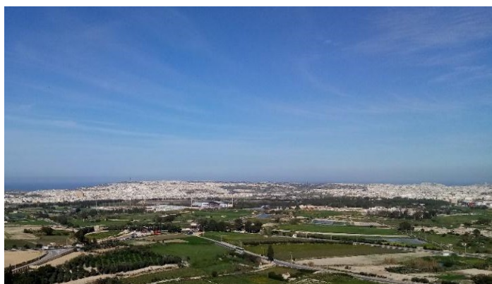
Ryc. 2. Widok zespołu miejskiego Valletty Fig. 2. Panorama of the Valletta agglomeration