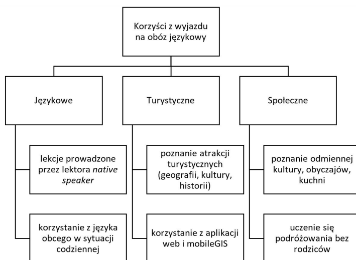
Ryc. 1. Korzyści z uczestnictwa w turystyce językowej młodzieży

Podsumowując, turystyka językowa przynosi uczestnikom wyjazdu korzyści daleko przekraczające możliwości nauki języka obcego. Pobyt w obcym miejscu, innym środowisku pozwala młodzieży nauczyć się asertywności wobec innych podróżnych, rodzin goszczących, lektorów, sprzedawców, ludzi spotykanych na ulicy. Jest także okazją do odwiedzenia ciekawych miejsc, zapoznania się ze środowiskiem geograficznym, historią i kulturą odwiedzanego miejsca. Na rycinie 1 zestawiono korzyści, które może osiągnąć młodzież uczestnicząc w wyjeździe na obóz językowy.