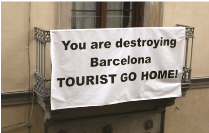
Fot. 2. Baner skierowany do turystów w Barcelonie (2010)