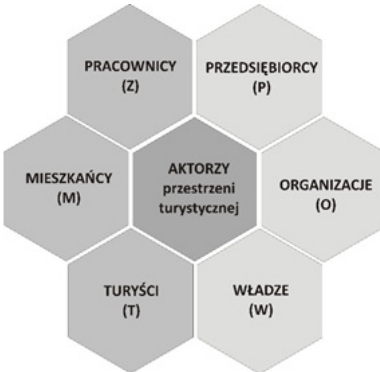
Ryc. 2. Grupy aktorów przestrzeni turystycznej