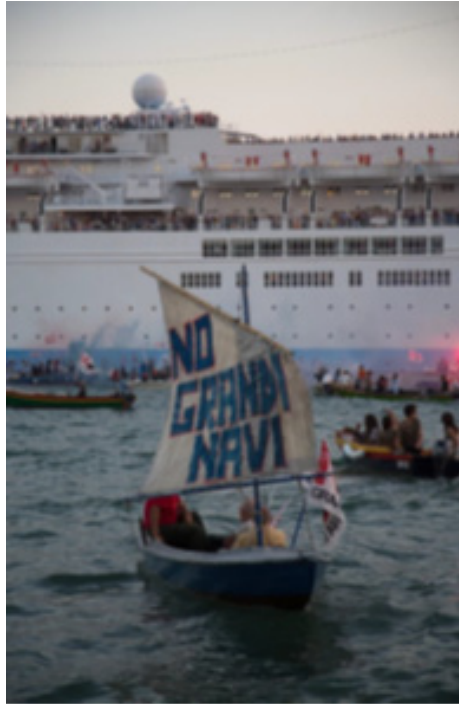
Fot. 1. Wenecja – blokada kanału Giudecca, wrzesień 2016

Photo 1. Protest event: blockage of the Giudecca Canal, Venice 2012