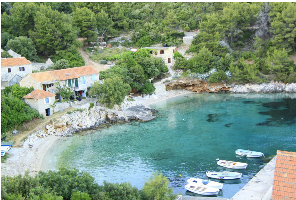
Fot. 1. „Robinsonada” w Zatoce Srhov Dolac Photo 1. „Robinson accommodation establishment” in Srhov Dolac Bay

„Robinsonady”, z założenia, nie są obiektami o wysokim standardzie i nie oferują swoim klientom zbyt wielu udogodnień. Jednak część z nich ma w swej ofercie różne usługi dodatkowe. Najczęściej spotykanym elementem jest murowany grill, w który wyposażonych jest 94% obiektów. Przy „robinsonadach” istnieje również możliwość zakotwiczenia (57%) oraz wypożyczenia łodzi (23%). W celu ułatwienia korzystania z brzegu morskiego przy połowie „robinsonad” funkcjonują betonowe mola. Wśród pojawiających się sukcesywnie udogodnień jest możliwość korzystania z telewizji (48%) i Internetu (28%) oraz klimatyzacja (23%). Zaledwie 5% obiektów oferuje możliwość skorzystania z całodziennego wyżywienia. Jednak w wielu z nich istnieje możliwość zamówienia kolacji w postaci grillowanych ryb i owoców morza (często złowionych przez właściciela) oraz zakupu regionalnych produktów spożywczych (sery, oliwa, oliwki, wina) ( www.zakwaterowanie-chorwacja.com ).