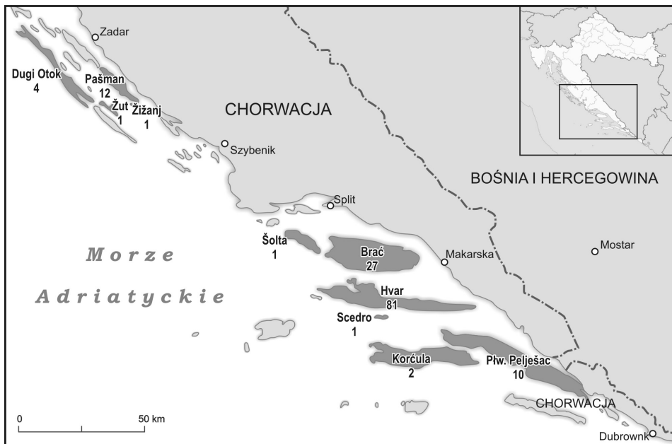
Ryc. 1. Położenie i liczba „robinsonad” w Chorwacji

Ważną cechą „robinsonad” jest ich położenie w rejonach o dużej atrakcyjności turystycznej, ale jednocześnie z dala od dużych centrów turystycznych. Obiekty te zlokalizowane najczęściej w odległych zatokach na wyspach i są odizolowane od ludzkich osiedli. Duża część z nich to domy będące pierwotnie niewielkimi domami letniskowymi bądź budynkami gospodarczymi zlokalizowanymi w sąsiedztwie winnic lub gajów oliwnych należących do Chorwatów mieszkających w położonych w pobliżu miejscowościach. W związku z tym do wielu obiektów nie prowadzi asfaltowa droga – w większości przypadków jest tam dość trudny dojazd prowadzący stromą, szutrową i bardzo krętą drogą (o długości nawet kilku kilometrów). Ponadto nie wszystkie obiekty są wyposażone w stały dostęp do prądu (w niektórych obiektach dostępny jest prąd z generatora) czy ciepłą wodę w kranie (czasami ogrzewana jest energią słoneczną). Wraz ze wzrastającym od kilku lat zainteresowaniem turystów tego typu obiektami, duża część z nich jest rozbudowywana.