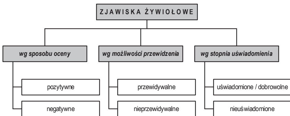
Ryc. 1. Różnorodności zjawisk żywiolowych

Zjawiska żywiolowe w przestrzeni są niewątpliwie jednymi z bardziej złożonych i różnorodnych. Zaliczają się do nich skrajne pod względem charakteru procesy, należące do tej samej kategorii (ryc. 1.).