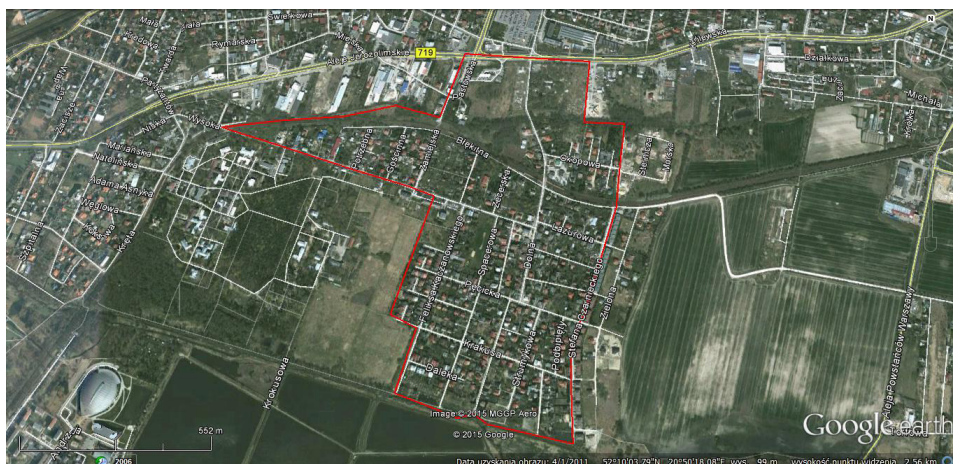
Ryc. 1. Osiedle Malichy