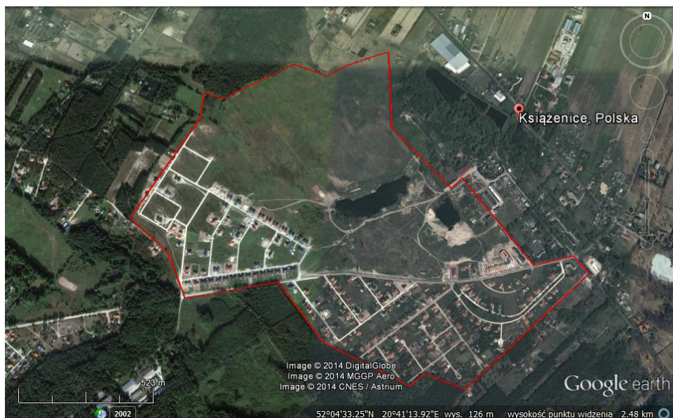
Ryc. 2. Osiedle Książenice

Większość istniejących obiektów zlokalizowana jest przy ul. Marylskiego. Koncentrują się one w pobliżu szkoły bądź budynku handlowo-usługowego przy wjeździe na osiedle, znajdującego się w niewielkiej odległości od szkoły. Pomimo zaplanowanych przez dewelopera przestrzeni publicznych, ich realizacja wciąż jeszcze nie została rozpoczęta. Przyszłe centrum ma powstać w pewnej odległości od aktualnie istniejących obiektów użyteczności publicznej, również przy ul. Marylskiego, która przecina osiedle na osi wschód-zachód. Wciąż niezagospodarowany pozostaje również teren wokół jeziora.