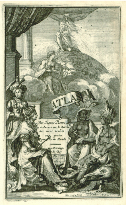
Ryc. 3. Jacques Peeters: „L’Atlas en Abrege ou Nouvelle Description du Monde”. Anvers: Chez l’Auteur aux quatre Paries du Monde, 1692. Frontispis