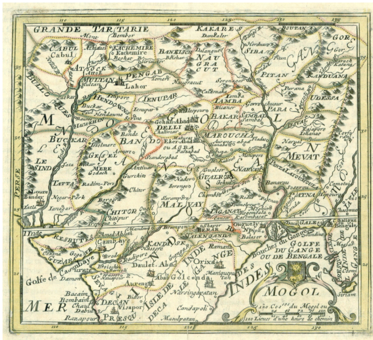
Ryc. 2. Jacques Peeters: „L' Atlas en Abrege ou Nouvelle Description du Monde”. Anvers: Chez l’Auteur aux quatree Paries du Monde, 1692. Mapa Imperium Mogolskiego z widocznym oznaczeniem Bhutanu