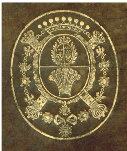
Ryc. 6. Supereklibris Jerzego Augusta Mniszcha i Marii Amalii Fryderyki z Brühlów Mniszchowej