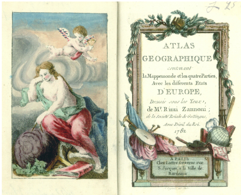
Ryc. 10. Giovanni Antonio Rizzi-Zannoni: Atlas Geographique contenant la Mappemonde et les quatre Parties Avec les differents Etats D'Europe. Paris: Lattré, 1782