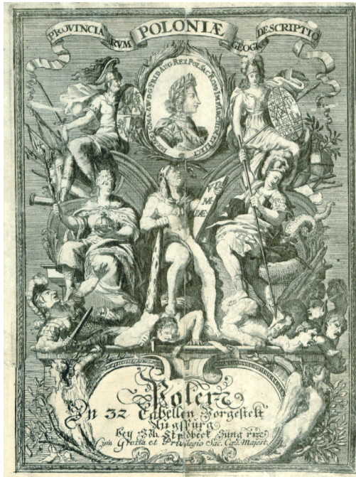
Ryc. 4. Johann Stridbeck: Provinciarum Regni Poloniae Geographica Descriptio Augsburg: Joh. Stridbeck, JÄžngern, Calcogr., [ca 1700], Frontispis