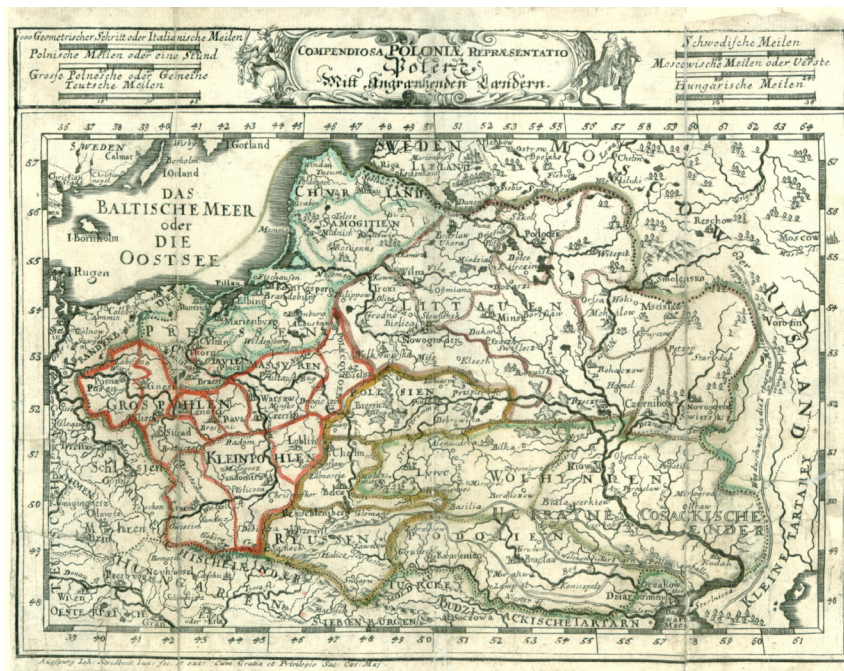
Ryc. 5. Compendiosa Poloniae Repraesentatio [w:] Johann Stridbeck: Provinciarum Regni Poloniae Geographica Descriptio. Augspurg: Joh. Stridbeck, JÄzngern, Calcogr., [ca 1700]. Mapa generalna Rzeczpospolitej