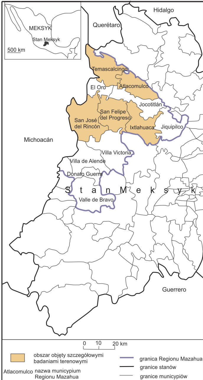
Ryc. 3. Obszar badań w Regionie Mazahua, Meksyk.