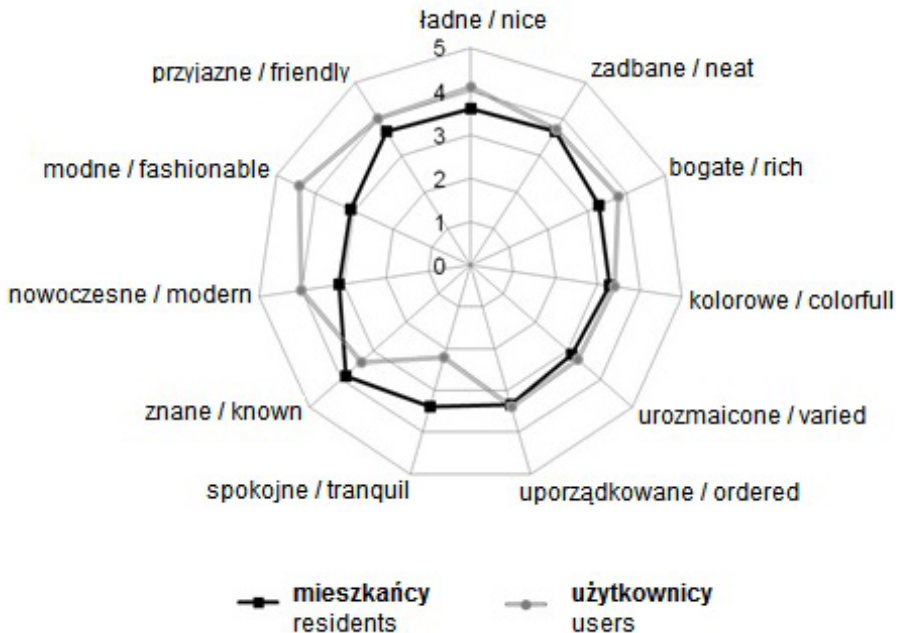
Ryc. 3. Wyobrażenia Powiśla w świadomości społecznej (źródło: opracowanie własne) Fig. 3. Image of Warsaw among respondents (source: own elaboration)

Badanie wykazało istnienie pewnych różnic w wyobrażeniach Powiśla. Profile graficzne reprezentujące ankietowanych zamieszkujących tą część Warszawy oraz użytkowników niebędących mieszkańcami mają nieco inny przebieg, jednak obie