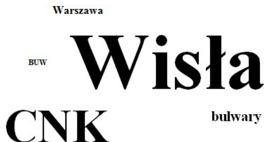
Ryc.1. Skojarzenia ze słowem „Powiśle”: A – skojarzenia mieszkańców; B – skojarzenia studentów; C – skojarzenia spacerowiczów Fig. 1. Associations with “Powiśle”: A - inhabitants; B - students; C - walkers