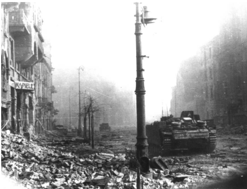
Fot. 10 i 11. Krakowskie Przedmieście w czasie walk powstańczych