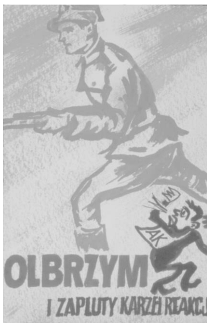
Fot. 20. „Nagroda” dla żołnierzy AK za udział w Powstaniu Warszawskim