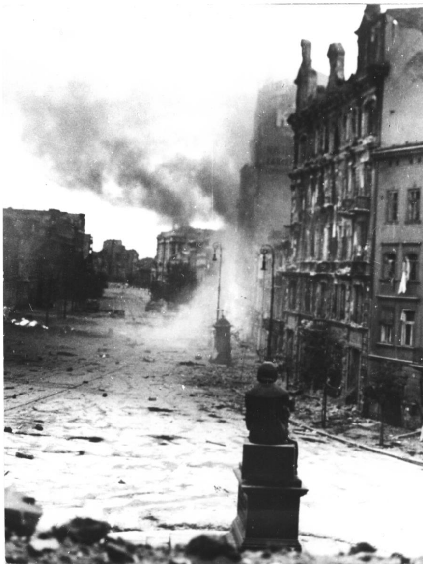
Fot. 12. Krakowskie Przedmieście w czasie walk powstańczych