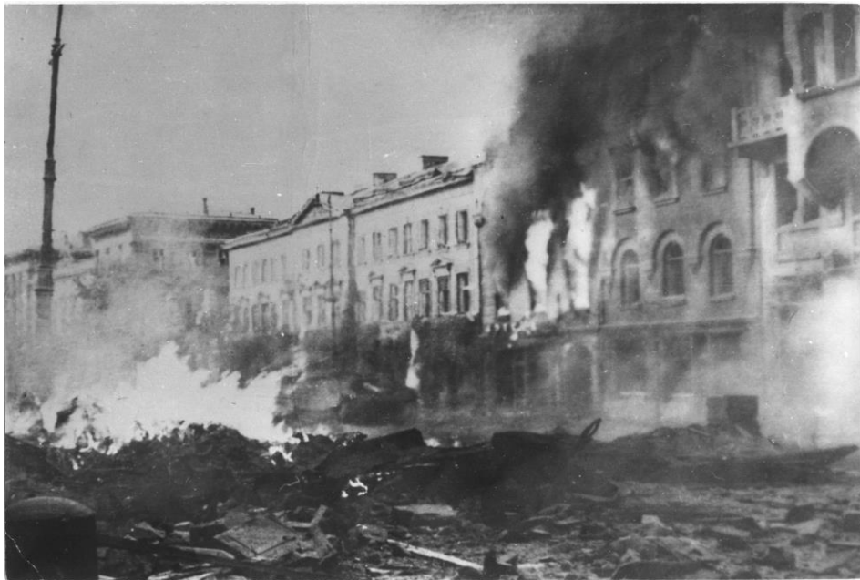
9. Krakowskie Przedmieście i pałac Uruskich, podczas walk o Uniwersytet