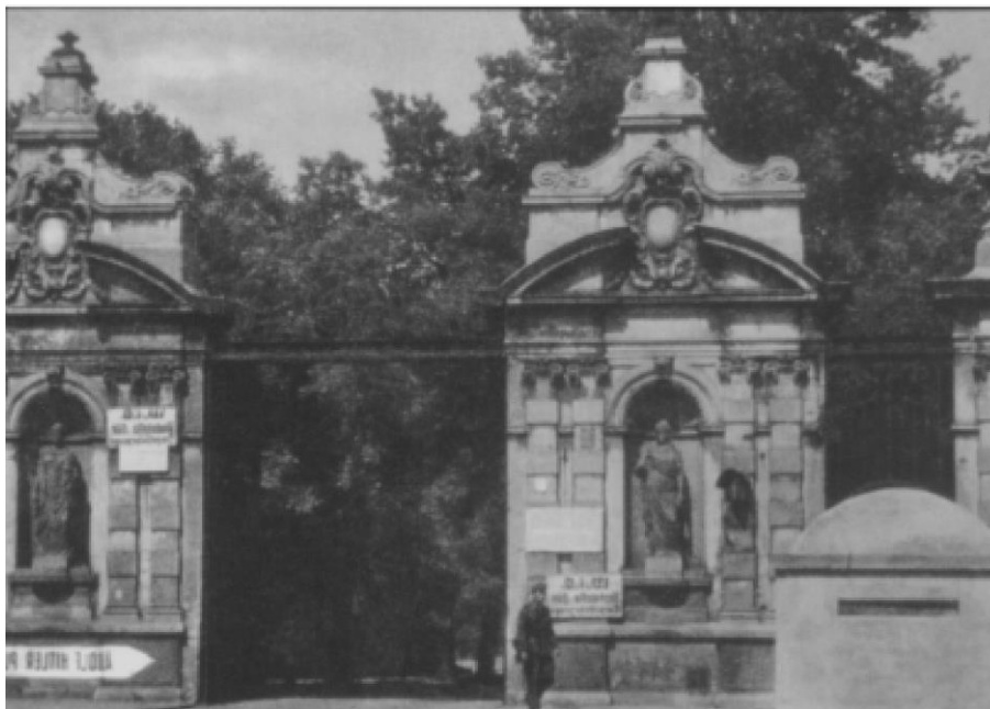
Fot. 6. Wejście do Uniwersytetu na krótko przed Powstaniem – niemiecki bunkier unieszkodliwiony przez powstańców podczas natarcia na Uniwersytet 23 sierpnia 1944 roku