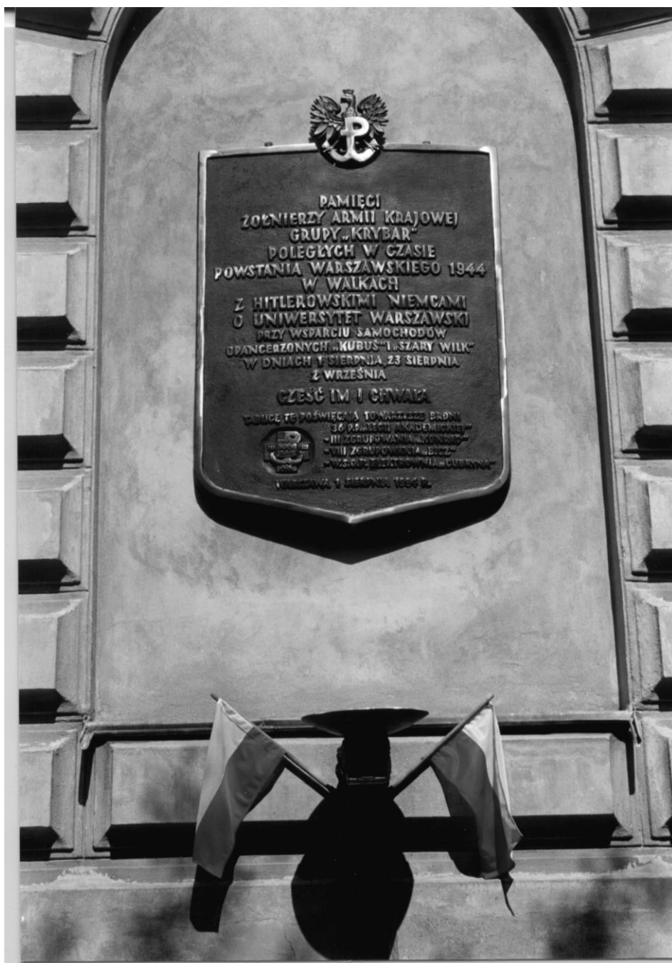
Fot. 18. Tablica ku czci żołnierzy „Krybara” na ścianie Pałacu Uruskich, mieszczącego dziś Wydział Geografii i Studiów Regionalnych UW