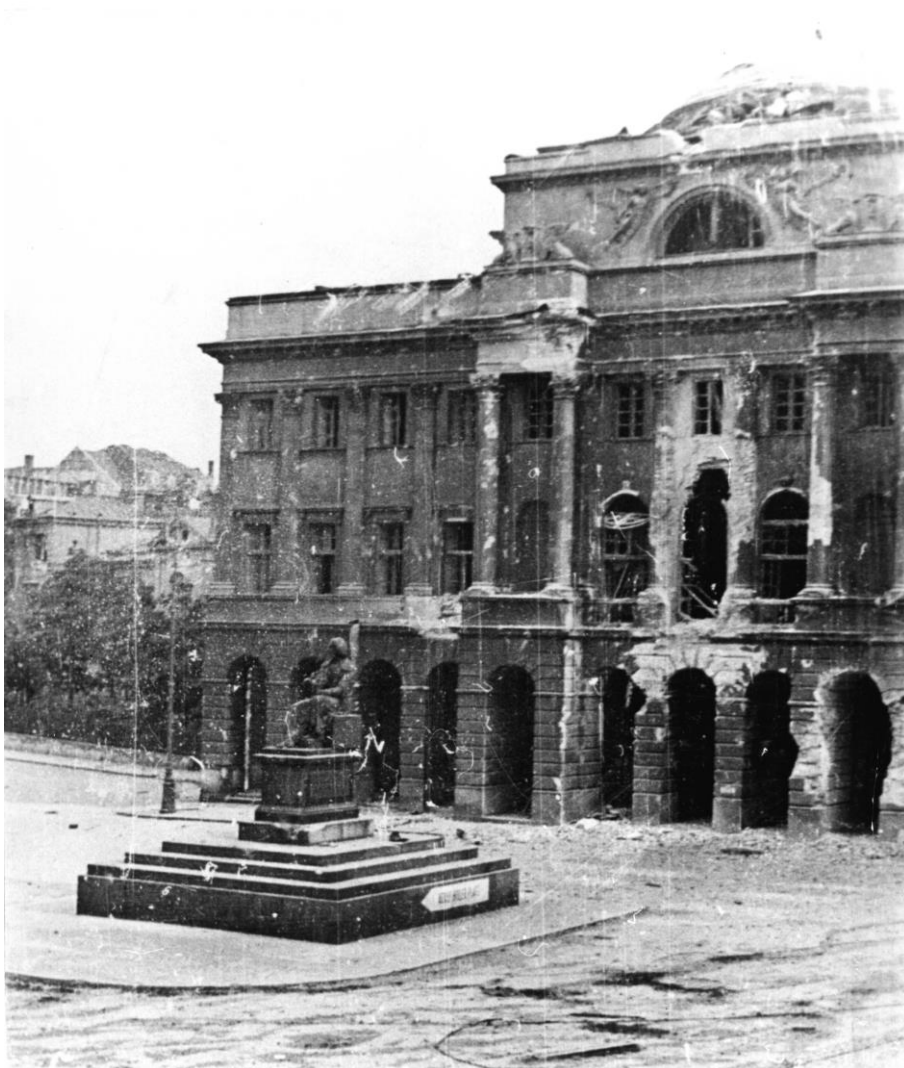
Fot. 15. Pałac Staszica podczas walk powstańczych, w którym mieścił się przed wojną Zakład Geograficzny Uniwersytetu Józefa Piłsudskiego