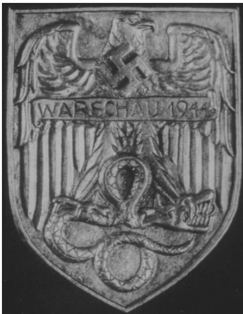
Fot. 19. Odznaczenie nadane żołnierzom niemieckim za udział w zwalczaniu Powstania Warszawskiego