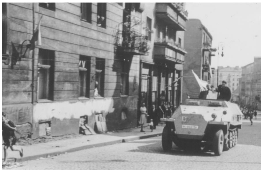
Fot. 14. Pojazd opancerzony „Szary Wilk”, który brał udział w natarciu na Uniwersytet 23 sierpnia 1944 r.