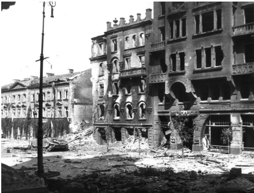
7. i 8.. Krakowskie Przedmieście i pałac Uruskich, mieszczący dziś Wydział Geografii i Studiów Regionalnych, podczas walk o Uniwersytet