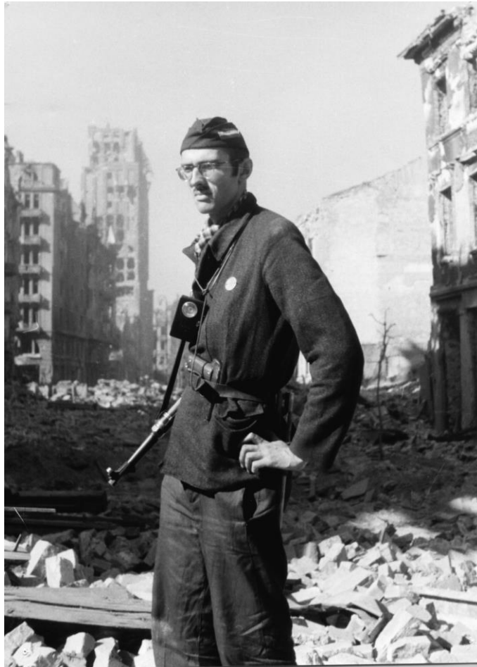
Fot. 17. Autor tych wspomnień, student I roku geografii tajnego Uniwersytetu Warszawskiego, żołnierz AK kapral-podchorąży „Machnicki” (odznaczony dwukrotnie Krzyżem Walecznych), niosący swoje „przemoczone pod plecakiem dziewiętnaście lat”