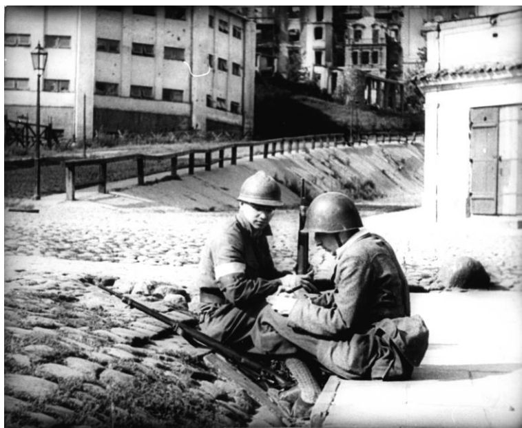
Fot. 13. Żołnierze „Krybara” na ul. Oboźnej, przed natarciem na Uniwersytet